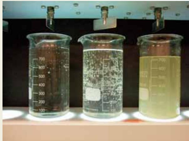
Gjett hvem som inneholder drikkevann?

vært på anlegget er forbløffet over renseseffekten, og slammet som går i containeren er som svakt fuktet pussesand. Det er også et pluss at det ikke er kloakkluft inne i rensianlegget i det hele tatt.