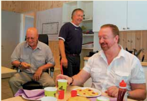
Vigrestad serverer fantastisk gode vafler.

3. juli fikk Rådmannen en eksklusiv omvisning på det nye renseanlegget på Hellvik. Eikebladet slengte seg med, og fikk en smakfull og teknisk opplevelse. Vann- og avløpssjefen forteller her om sitt hjertebarn: